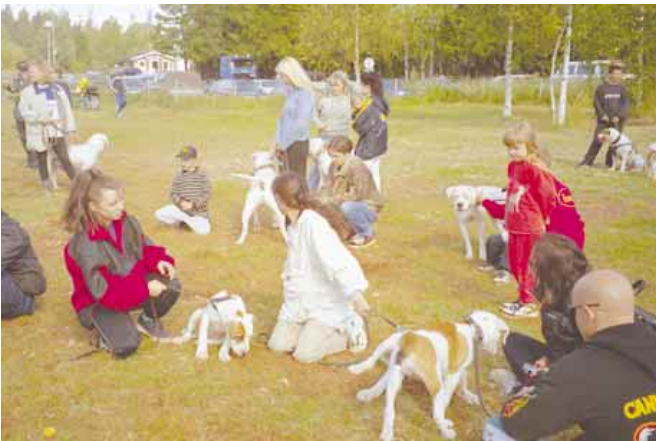
Onpas täällä paljon amerikanbulldoggeja!

jää mieleen mutta rohkeus ei vielä riittänyt kysyä neuvoa, niin ei muuta kuin puhelinsoitto Sathyyn niin koulutus pääsee alkamaan.