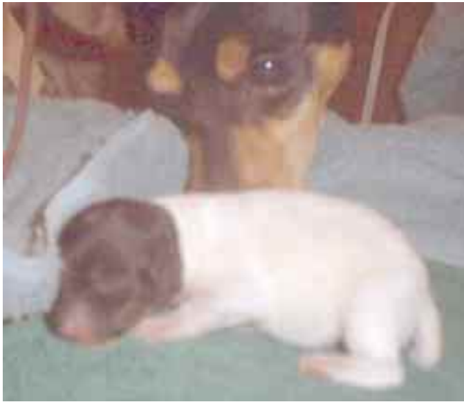
Nämä pikku pirpenot syntyivät kaikki tiistaina 31.10.2000.