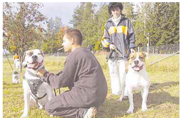
Paikalla koko perheen voimalla.