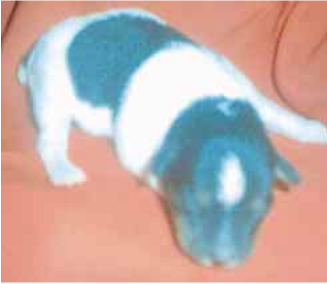
Sisaruksista yksi tyttö ja yksi poika matkaavat kylmään pohjolaan heti vuoden 2001 alussa.

essa, viimeistään kuitenkin kesään mennessä. Toinen näistä koirista tulee olemaan tyttö ja se menee lemmikiksi ja toinen poika, jota tullaan käyttämään astutuksessa. Nämäkin koirat menevät eri perheisiin.