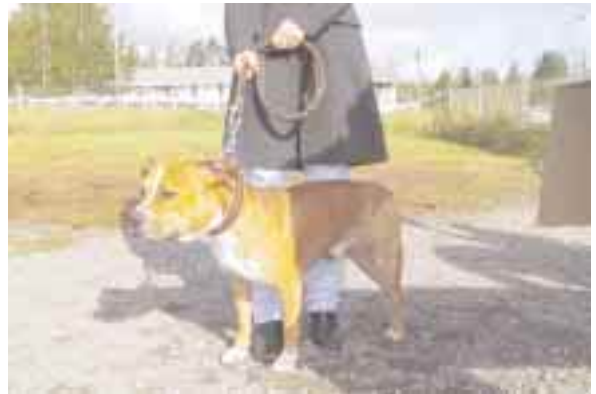
Rohkeimmat saapuivat jopa sairauslomalta Expoon.