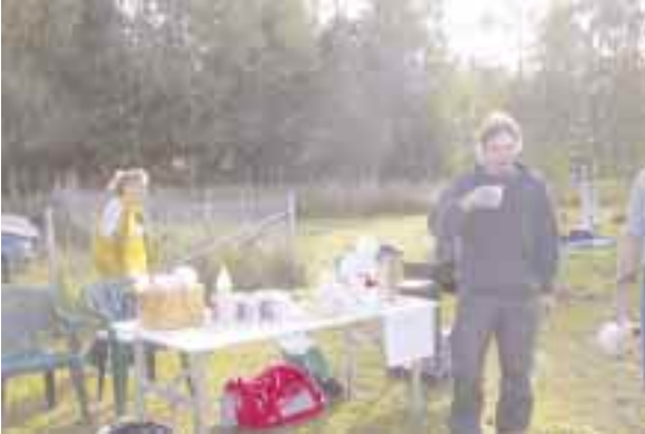
Kuppi kuumaa kahvia tekee terää.