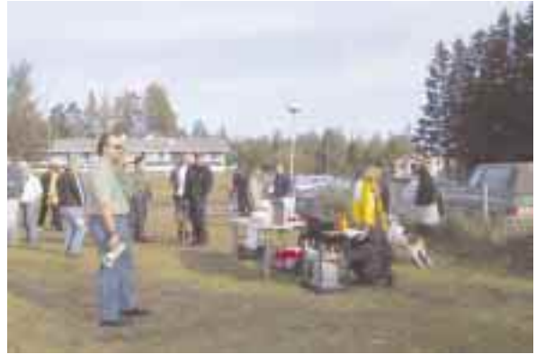
Mies ja megafoni – tuttu näky.