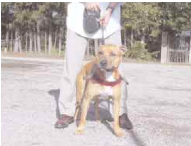
Paikanpäällä oli uusia tuttavuuksia.

Ensi vuonna koostamme jälleen ja siksiäpä toivotamme kaikille jo tässä vaiheessa – Tervetuloa!