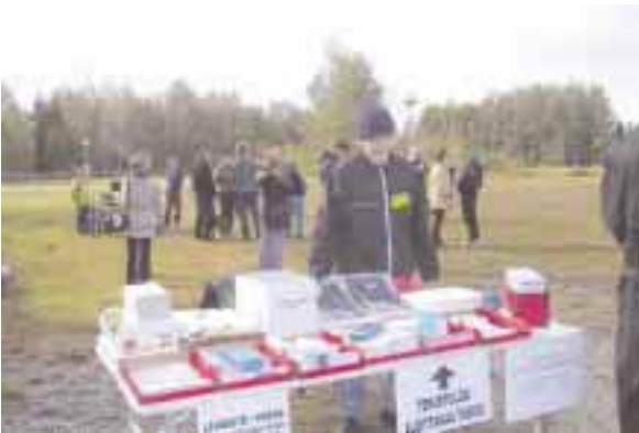
Sathyn infopisteestä sai ajankohtaista tietoa.