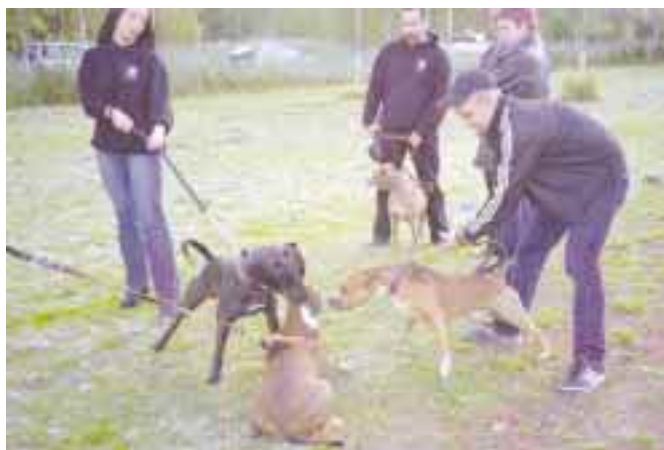
Pitbullit tekivät tuttavuutta keskenään, omistajien roikkuessa hihnan jatkeena.