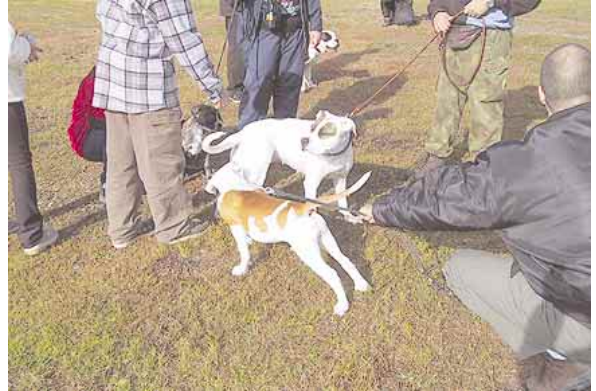
Ja mitäs tänne kuuluu?