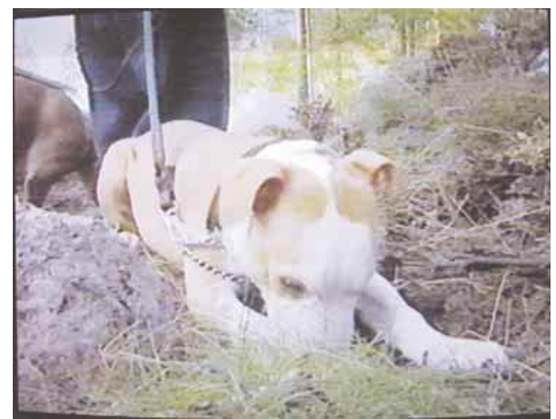
Ruudussa esiintyi myös staffi.