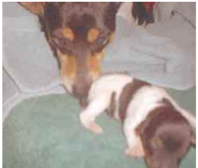
Tästä viiden pennun pentueesta kaksi onnellista päätyy Suomeen.