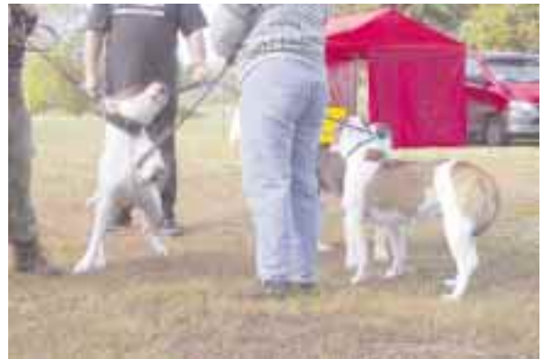
AB:t leikkiä lyö.