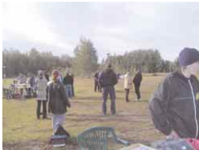
Alkuaamun syksyinen koleus piti monen koiran ja koiran-omistajan aamulla vielä vällyjen välissä. Lämmin kuppi kahvia olikin iloinen yllätys saavuttaessa Expo-alueelle!

taa olikin makkaran ja kahvin loppuminen kesken kaiken! Ensi kesänä buffet-pöydän pitäjät osaakin varustautua kunnon eväin ja lupaili, että ensi vuonna ei syötävä tai juotava lopu. Kaiken kaikkiaan kaikki meni odotettua paremmin, taakanveto innosti ihmisiä erittäin paljon ja kaikki koirat ja omistajat käyttäytyivät mallikkaasti. Ensi vuonna uudestaan – ja entistä paremmin varustautu neena!