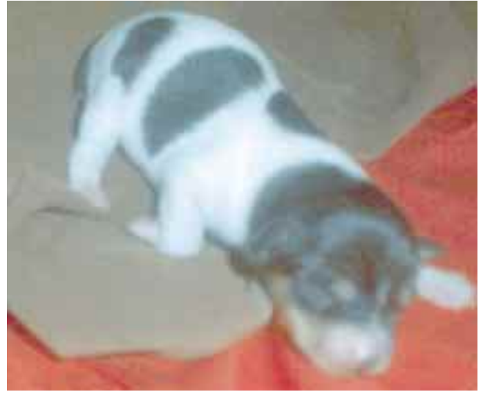
Pennut ovat juuri nyt siinä iässä että ne availevat ensi kertaa silmiään.

Vuoden 2001 Sathy Expoon on kehitteillä amerikankääpiöterriereitä varten ihan oma expo-juttunsa, joka luultavimmin liittyy jollain tavalla koiran pienen kokoon ja vikkelyyteen. Kaikki ideat, osanotto, aktiivi-