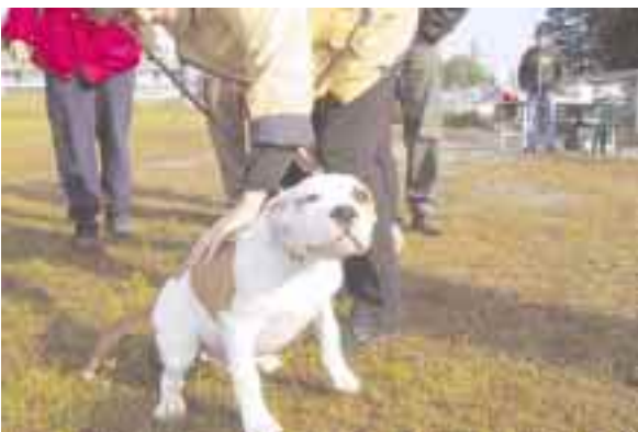
Joo, paijatkaa vaan meikäläistä!