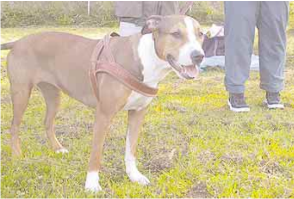
Onkos täällä sitä pitbull-seuraa?