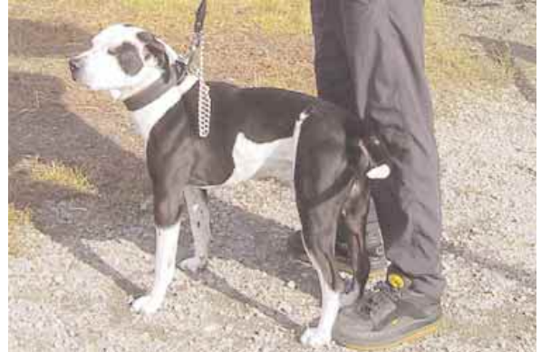
Tämä pitbulli tuli ajoissa paikalle.

Sathyn järjestämä taakanvedon virallinen Suomen mestaruuskilpailu herätti koirissa ja omistajissa ennalta arvaamatonta innostusta. Kokeiluun osallistui tuhti nippu Suomen eittämättä parhaita koiria mutta vastus olikin yllättävän hankala. Koirat olivat ihmeissään, kun ilman harjoittelua olisi pitänyt raahata perässään jotain omituisia kärejä – ja vieläpä kaiken kansan edessä! Omistajilla olikin selvät aiheet että ensi kesäksi taakanvetoa tul laan harjoittelemaan ihan oikeasti, sillä tähän ei ole missään nimessä voimalaji, vaan tekniikkalaji. Tähän harjoitteluun antaa oivan lähtöpotkun oikeat taakanvetovaljaat joita on nyt mahdollisuus tilata ennakoon joulukuun ajan aivan