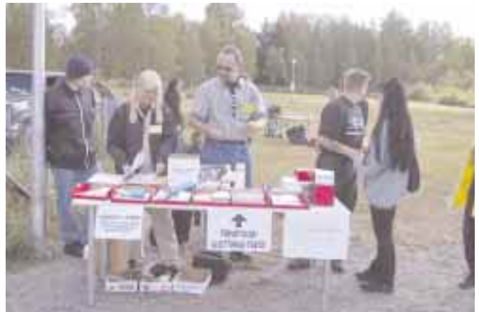
Arpajaisliput menivät kuumille kiville.