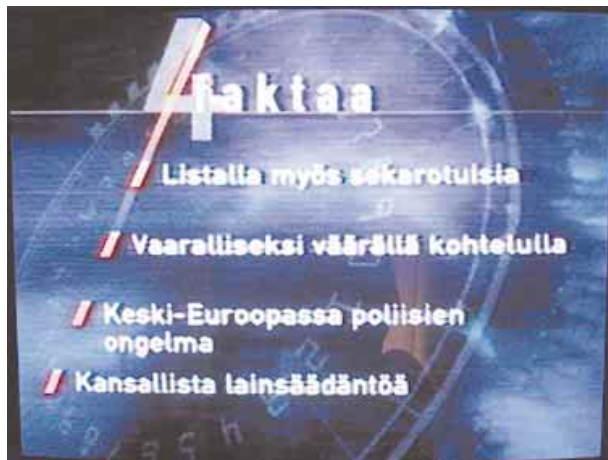
Ohessa kuvia Nelosen uutisista.