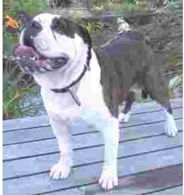
Tankki vanhaenglanninbulldoggi on Suomen ensimmäinen VEB-koira. Tankki on huomiota herättävän upea ja seuraavan kerran Tankkia voi ihaillla syyskuussa käyntiin pyörähtävässä Muhku -sämpyläkampanjassa. Muhku/Tankki -mainoksia tulee esille ainakin kadun varsille ja isoimpiin lehtiin.

Olde English Bulldogge, eli vanhaenglanninbulldoggi, on uudelleen henkiin herätetty 1800-1900 luvun vaihteen