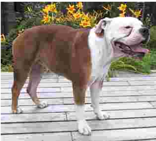
Meku vanhaenglanninbulldoggi on Suomen ensimmäisen VEB-pentueen emä. Meku on reipas, reilu 1-vuotias erinomainen narttu.

Tänä päivänä moni tekee pentuja VEB -koirillaan,