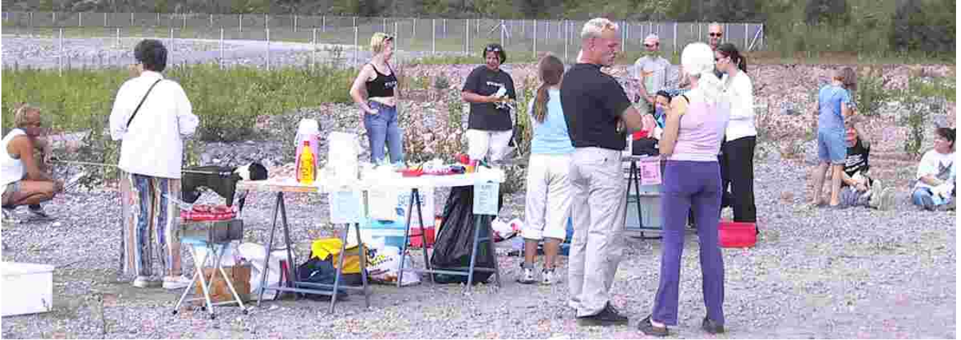
SATHY Buffet ja SHOP SATHY kiinnostivat Kisapäiväläisiä erityisen paljon.

Sunnuntaina 4.8 pidettiin SATHY:n kisapäivä, jossa Suomen parhaat työkoirat kisailivat taakanvedossa, voimavedossa ja tuholaistorjunnassa. Sää helli osanottajia paahtavalla helteellä, joka pisti kestävyuden koetukselle. Koko päivän kuumana porotanut aurinko kirvoitti hien pintaan koirille ja omistajille. Varsinkin taakanvedossa helle verotti tuloksia. Ranking-pisteille pääsivätkin vain kovimmassa kisakunnossa olleet koirat ja ranking-pisteitä jaettiin tuttuun tapaan sijoituksen mukaan. Mukavaa riitti ja paikalle mukaan tullut reilu osanottajajoukko pääsi nauttimaan sään lisäksi hienoista koirista ja mukavista ihmisistä.