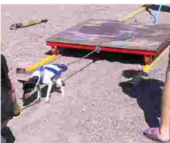
Amerikankääpiöterrierit pärjäivät taakanvedossa suhteessa isoja koiria paremmin.

Amerikankääpiöterriereiden omassa lajissa, tuholaistorjunnassa, saatiin aikaan hienoja tuloksia. Uudet tulokkaat Nicky ja Nekku pärjäivät tässä lajissa mainiosti! Tätä lajia on erittäin helppo treenata kotona, eikun minivalehiiri narun päähän ja koiran kanssa leikkimään! Leikkihiiriä saa ostaa esim. Tarjoustalosta. Onpa moni akt:n omistaja treenannut koiransa kanssa kesän aikana mökillä oikeiden hiirienkin kanssa, ja siihenhän amerikankääpiöterrieri on jalostettukin!