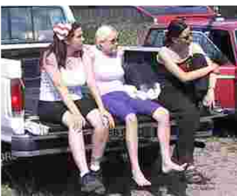
Pickupin lavalla oli hyvä ottaa aurinkoa ja katsella tapahtumia.