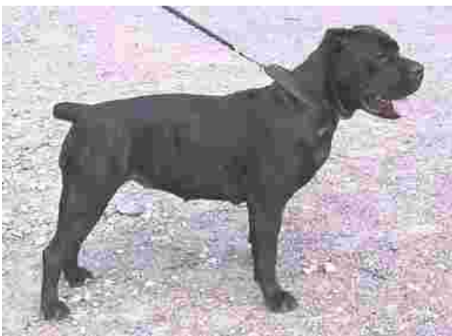
Donna vanhaenglanninbulldogginarttu on Suomen VEB-koirien nuorimmasta päästä. Donnan pentuja voi kysellä SATHY ry:n kautta vuoden 2003 puolella tai vieraille Internet-osoitteessa www.olderanch.com