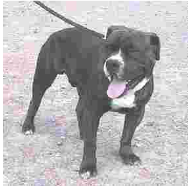
Bruce vanhaenglanninbulldoggi on muiden Suomen VEB-koirien tapaan rekisteröity ARF:ssa.

Lisäksi on muistettava, että vanhaenglanninbulldoggi vielä on harvinainen koirarotu. Yhdysvalloissa näitä koiria on yhteensä alle tuhat ja Euroopassa kanta on yhteensä muutaman kymmenen yksilöä käsittävä.