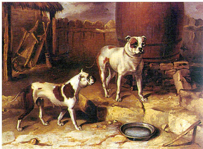
Crib ja Rosa, 200 vuotta sitten maalatussa taulussa kaksi nykyisten amerikanbulldogien esi-isää.