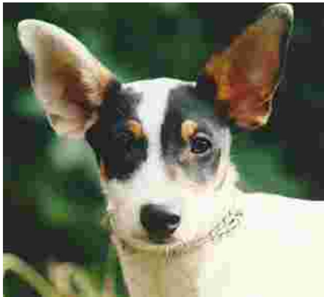
Kääpiöterrierin valpas katse on saavuttanut monen koiraharrastajan suosion.