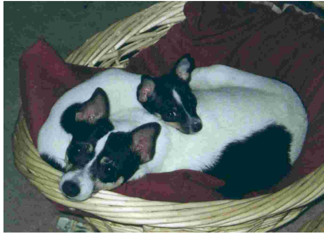
Kuvassa Delta Dawn ja sen pentu Blue.

Rehellisesti sanottuna, ei harmainta aavistustakaan. Kennelini koko on vaihdellut vuosien varrella, joinain vuosina minulla on 20 pentuetta, joinain vuosina yksi. Olen kuitenkin kasvattanut ja jalos-