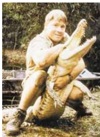
Steve "The Crocodile Hunter" Irwin lempipuuhaansa!

Tv Nelonen esitti 4.10.2001 kello 20.30 ohjelman "Krokotiilimies, pää kidassa". Kansainvälisen eläintenpäivän epävirallinen ohjelma seurasi Animal Planet -ohjelmasarjasta kuuluisan australialaisen Steve "The Crocodile Hunter" Irwinin ja hänen vaimonsa Terrin jännittäviä kohtaamisia erilaisen eläinten kanssa. Kuvissa vilahteli niin alligaattoreita, krokotiileja kuin herra Irwinin pitbullikin! Pitbullinarttu nimeltään Sui on ehtinyt kunnioitettavaan 10 vuoden ikään joka näkyi jo kauniisti harmaantuneesta kuonosta.