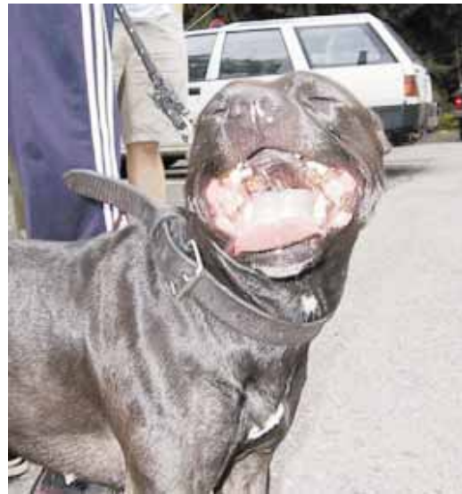
Amerikanpitbullterrieri Holopainen haukottelee tässä oikein olantakaa.

Tällä kertaa mukaan on eksynyt pari likaista amerikanbulldoggia sekä pari elämästään nauttivaa amerikanpitbullterrieriä.