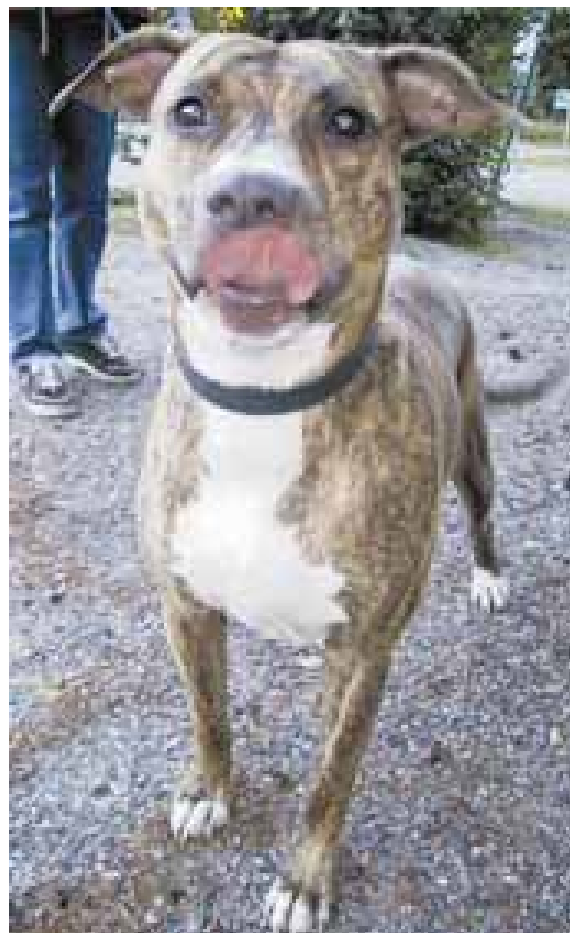
Amerikanpitbullterrieri Dayah on oikea herkkusu. Heti kuin ohi liivahatta palanen kinkkua, niin rouva D lipoo kieltään. Kuvan lähettäjänä Terhi Es-poosta.

Lähetä oman lemmikkisi kuva! Sähköpostitse info@sathy.org tai postitse SATHY ry. Mannerheimintie 93 c 147 00270 Helsinki