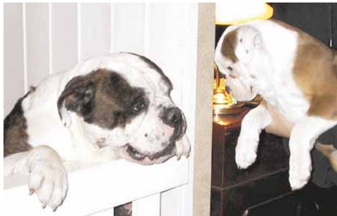
Tankki (vas.) tutustuu uuteen perheenjäseneseen Mekuun.

Syyskuun 11. päivän jälkeen on USA:sta ulkomaille (ja päinvastoin) lähtevä kaikki lentoliikenne ollut erityisen syynin kohteena. Koiriin kohdistuvat