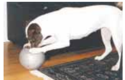
Nyt maistuu jo pallo, eikä yhden hampaan puuttuminen juurikaan häiritse!

SM 2001 Taakanvetäjä, amerikanbulldogginarttu Susy