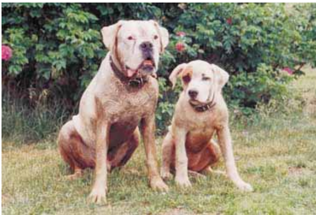
Amerikanbulldogginarttu Susy (oik.) ja paras kaverinsa "valkoinen" bokseri ovat telmineet oikein mutakylvyssä...