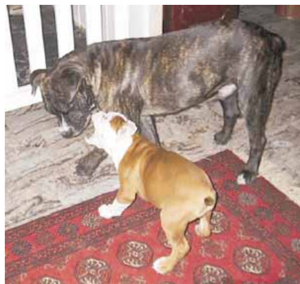
Bruce (vas.) ihmettelee uuden Meku-VEBin pienuutta ja hurjuutta!

Vanhaenglanninbulldoggi-asiat ovat Suomessa todella hyvällä mallilla. Jokainen yksilö on erikseen etsitty ja valittu periaatteella parhaista parhain.