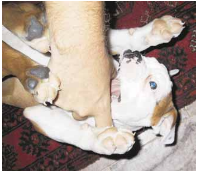
Meku on Suomen uusin vanhaenglanninbulldoggi.

rajoitukset ja säännöt ovat tiukentuneet siinä määrin, että ongelmia on varmasti tiedossa. USA on määrännyt uusia sääntöjä liittyen maastavientiin ja yksi näistä säännöistä on se, että koiraa lähtettävän henkilön on täytynyt lähettää joltain maasta jo 24 kertaa aikaisemminkin. Tämä aiheuttaa tietysti ongelmia, sillä puhumme kuitenkin kasvattajista, joiden päämarkkinat ovat kotimaassaan USA:ssa. Ongelmia ilmeni siis myös Mekun kanssa. Onneksi sen kasvattaja on aito VEB hemmo, joka ei pienistä säikähä! Tolkuttoman paperiso-