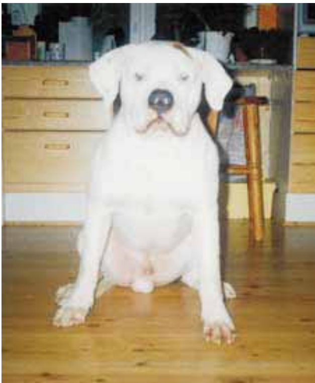
Amerikanbulldoggiuros Kronos on varsinainen linsilude, tässä elävä esimerkki! Kuvan lähettäjänä Minna Loimaalta.