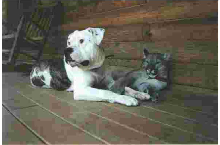
Suomalaiset amerikanbulldogit valloittavat maailman. Tässä aina valpas talonvahti, ab-koira, köllii kaverinsa puuma-eläimen kanssa.

Amerikassa rodun suosio on ollut tasaisessa kasvussa. Isokokoisena ja näyttävän näköisenä amerikanbulldogi saavuttaa helposti myös sellaisen yleisön mielenkiinnon, joka ei ehkä muuten kiinnostuisi palvelus- tai työkoirasta. Tästä on seurannut myös lieveilmiöitä, kuten näyttelypohjainen pentutehtailu, ts. ei paneuduta rodun perimi-