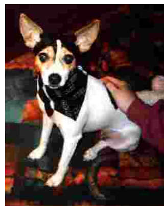
SATHY EXPO:ssa on suuri mahdollisuus törmätä tähän suojelukoiraan.

Jos tuot koirasi näyttelyyn, soita meille etukäteen ja kerromme yksityiskohdat. Näyttelyyn osallistuminen ei maksa koiralta eikä