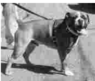
Tuhti vanhaenglanninbulldogi isäntänsä seurana.

se enää muistuttanut tuota sonnin leppymätöntä vastustajaa, bulldogia.