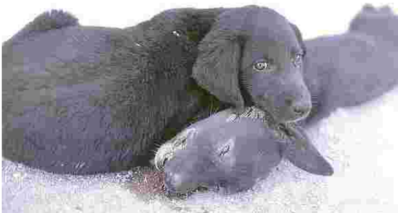
Koiranpentu myrkytetyn emonsa kanssa Kreikassa.

Liittoutuma perustettiin kesäkuussa 2002, ja sen tarkoituksena on yrittää vaikuttaa Kreikan hallitusta ottamaan vastuun maan kulkukoirien ja -kissojen hyvinvoinnista paneamalla toimeen kansallinen