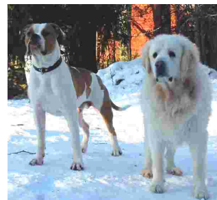
Kuvassa vasemmalla amerikanbulldoggi DJ kaverinsa Slovakian Kuvacin kanssa.

Pojat tulevat kuitenkin todella hyvin toimeen, vaikka DJ (amerikanbulldoggi) on jo 1,5 vuotias ja hormoonit hyrrää. Tässä kuva jossa DJ:n kaverina 6 vuotias Slovakian Kuvac uros. Ilman suurempia erimielisyyksiä.”