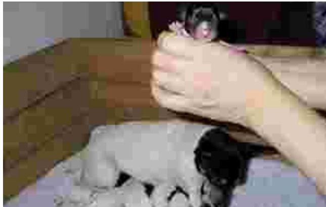
Suomeen syntyi ensimmäinen rekisteröity akt-pentue.