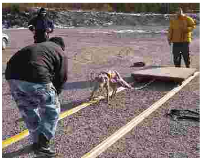
Painoja laitetaan sitä mukaa kun koiran taakanvetotaidot kehittyvät.