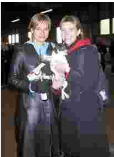
Voittajan on helppo hymyillä. Eppu oli Tuholaistorjunnassa ylivoimainen voittaja.