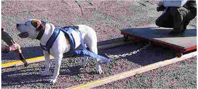
WP-treeneissä kaikki houkuttimet ovat sallittuja, mutta kisoissa ollaan ankarampia.

Jos tuntuu siltä, että omalla koiralla on kykyjä vetää ahkiota niin tervetuloa mukaan kokeilemaan!