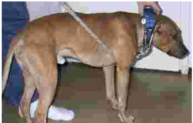
Ennenkuin koirat oppii olemaan vetämättä, voi tilanteen korjata tilapäisellä vedonestolla. Koukkaa talutin koiran jomman kumman etujalan alta kuvien osoittamalla tavalla.