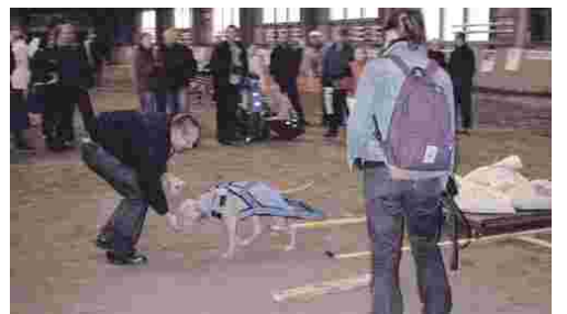
Alhaalla: Moni kyseli avustajilta, miten moiset suuret taakat ovat mahdollisia vetää. No, kyseessä ovatkin Pohjoismaiden mestaruuskisat!