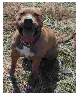
Norjalainen pitbullterrieri Sara.