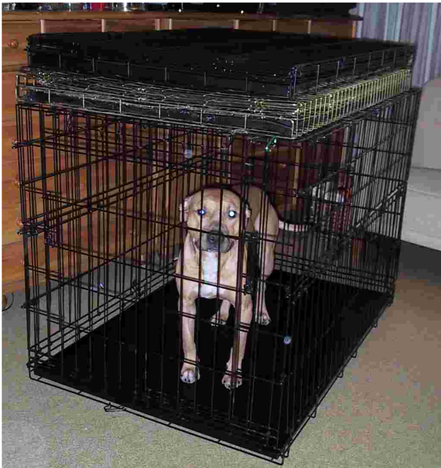
Kuvassa Feanorin suurin häkkimalli ja sisällä amerikkalaispitbullterrieri. Häkin päällä on kokoon taitettuna kaksi samankokoista häkkiä jotka menevät aika pieneen tilaan.

Hyviä ja erityisesti SATHY:n jäsenille edullisia häkkeitä saa ostaa Feanor Oy:stä, jonka alennuksiin oikeuttava arvoseteli seuraa tämän lehden mukana. www.feanor.fi