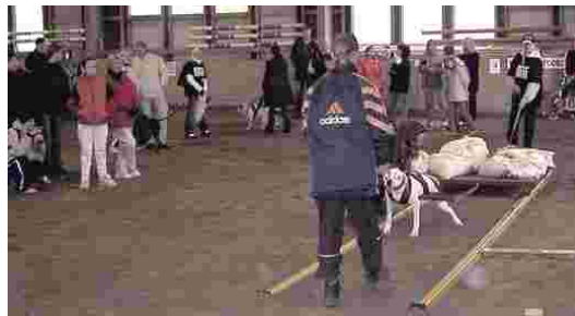
Ylhäällä: Taakanveto keräsi huippu-osaajia sekä isoista että pienistä SATHY roduista.