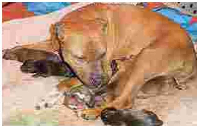
Suomeen on syntynyt toinen rekisteröity pitbull-pentue.