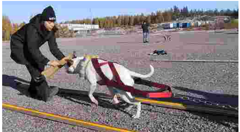
Omiin valjaisiin on helppo lisätä tarvittavat pehmusteet.