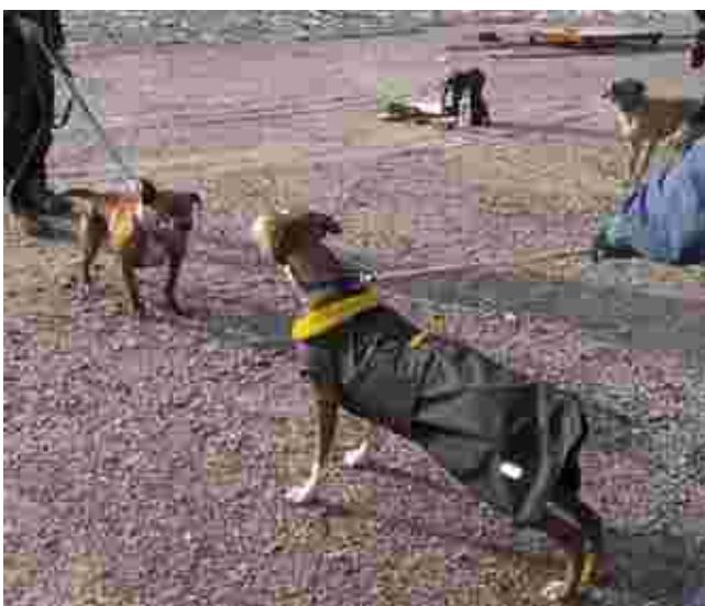
WP treeneissä saattaa tavata tuttuja koiria ja ihmisiä. Monella on mukana omat eväät.