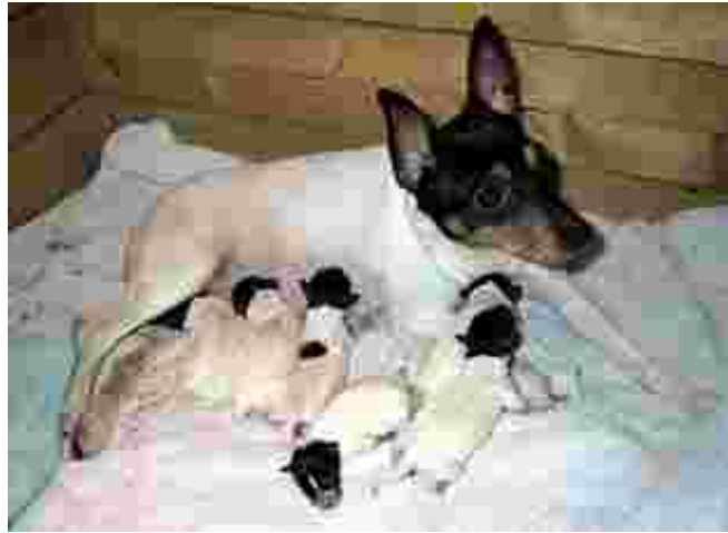
Suomeen syntyi 19.12.2002 ensimmäinen rekisteröity amerikankääpiöterrieri-pentue.

Tässä lehdessä käsittelemme syyskuun lopun megalomaanista SATHY Expoa sekä kuvin että tekstein. Itse SATHY Exposta voi jokainen