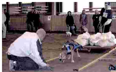
Oikealla: Pitbull valmistautumassa taakanvetoon.