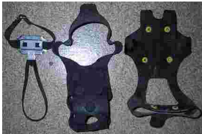
Liukusteet voivat estää vakaviltakin onnettomuuksilta. Kuvassa muutamia erilaisia liukusteita.

Lenkillä ulkoiluttajaansa hurjasti eteenpäin vetävä koira saattaa varotoimista huolimatta aiheuttaa noloja ja jopa vaarallisia tilanteita vetäessään ulkoiluttajan nurin. Vastaavannaisia tilanteita on jokainen koiranomistaja varmasti joskus kokenut. Murtunut häntäluu ei