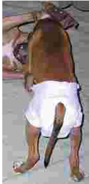
Vaippa voi olla koiravauvallekin hyvä apu sisäsiistiksi opetellessa.

Kun koiran mielipuuhaa on järsiä jokaista mahdollista keppiä, kiveä, kantoa, käpyä, remmiä, hihnaa ja kaikkea muuta