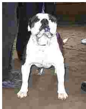
Vanhaenglanninbulldogien ystävät löysivät VEB koirat omalta osastoltaan.