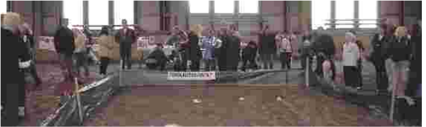
Tuholaistorjunta kiinnosti yleisöä ja median edustajia erityisen paljon.