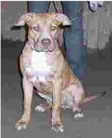
Paikalla oli ennätysmäärä uusia koiria.