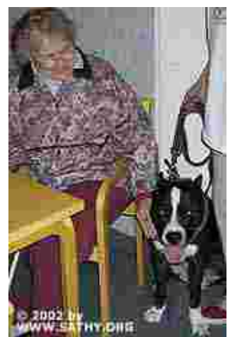
Usein pelkkä läsnäolo riittää. Koira on ihmisen paras ystävä.