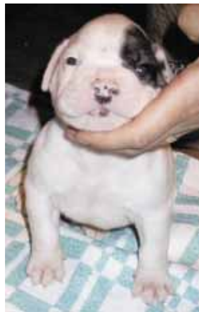
Venäläisen hybridi-pentueen satoa.

viikon ikäinen kun sitä käyt katsomassa, niin on sulla aika- moinen urakka edessä. Kyllä sen ikäisen valinnassa on enemmänkin onnea kuin mi- tään muuta siinä minkä niistä vipeltäjistä valitset. Otat yhden käteen ja se on suloinen, otat sen toisen käteen ja sekin on... Ei kun onnea vaan valintaan!