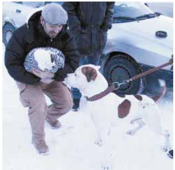
Amerikanbulldoggi Korsan suojautuu uuden omistajan sylissä Suomen talvessa villapaitaan! Suomalainen ab tervehtii uutta tulokasta.