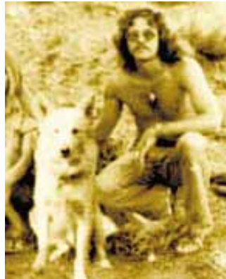
La Flamme (oik.) ja Buffalo Bill -koira.

Pohjois-Amerikan tasan-kointiaaneilla oli satoja vuosia sitten koiria siinä missä kaikilla muillakin tavallisilla tallaajilla.