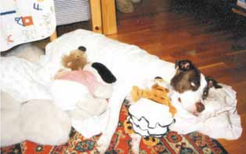
Ada pitbulli ottaa mieluusti kunnon torkut hyvän jouluaterian päälle! Onneksi pukin kontista tuli pari pehmolelua lisää!