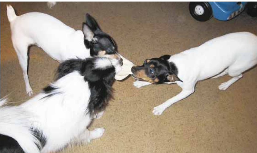
(alh.) Tänne se sukka! Kyllä kaksi amerikankääpiöterrieriä aina yhden perhoskoiran päihittää... Kuvassa akt Eppu (vas.) ja akt Elli repimässä omaansa takaisin!