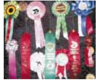
Nyt venäjälle palkintoja kahmimaan!

Kysy tullista mitä papereita koiralla tulee olla. Tietävät myös mitä venäläiset vaativat.