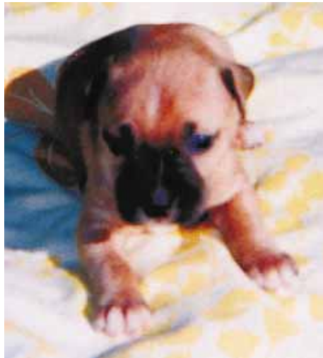
Vise-Grip's Lady Strange

Yllä on kahden uuden Suomeen tulevan pitbullin sukutaulu. Sukutaulusta näkyy hyvin hieno murrosvaihe, jota Californian Jack on viemässä läpi. Tämä sopii hyvin Suomessa tällä hetkellä oleviin saman linjan koiriin. Tällä pentueella sisäsiitosaste on karkeat 12 %. Jos Suomeen nyt saapuvat uudet nartut osoittautuvat hyviksi muutaman vuoden kuluessa, niin meillä on kaikki valmiudet linjalostukseen puhtaasti Suomessa nyt olevilla koirilla. Kärsivällisyys kannattaa. Suomi on saavuttanut viimeisen parin kymmenen vuoden aikana maailman kärkiaseman huippuunsa jalostetuilla pitbulleilla.