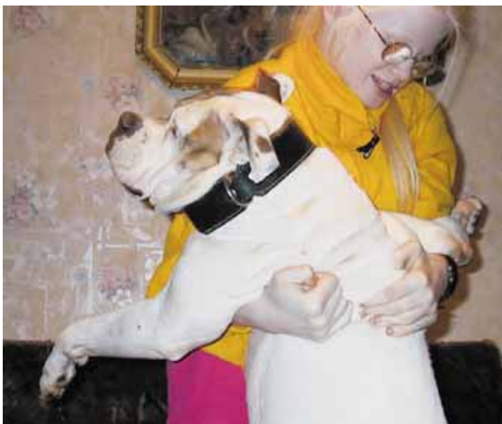
Osa Venäjän amerikanbulldoggeista on mahtavia ja ylväitä vahtikoiria – ja osa ei.

saamme kuitenkin vasta myöhemmin lukea amerikanbulldoggien historiikista. Tämä on asia mistä aina voidaan vain spekuloida ennenkuin todellinen fakta tulee esille. Aika näyttää.