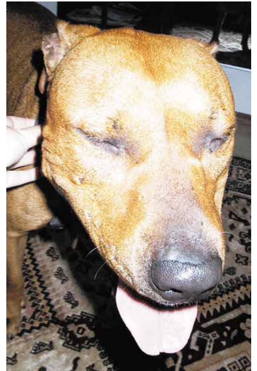
Mikäs sen mukavampaa kuin kunnon pajjaus, tuumii Peppi pitbulli.