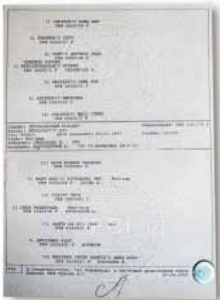
Hologrammilla varustettu RKF:n sukutaulu rekisteröidylle ameri-kanbulldogille.

Ja sitten jos edelleen harkit-set vakavissasi ryhtyä kasvat-tajaksi niin voit kysyä neuvoa esimerkiksi ABC-klubista (tie-ttoa penturekisteröinnistä, yksittäisen koiranrekisteröinti). Tai jos mietit mitä tekisit niiden saamattomien papereiden kanssa, ota yhteyttä niin he varmasti katsovat miten voisivat tehdä juuri sinun asiallesi.