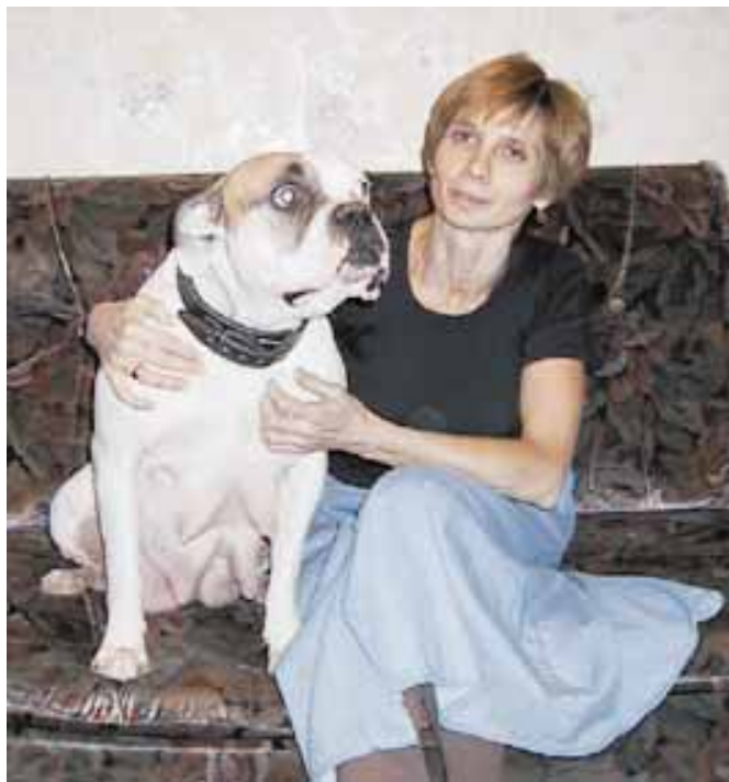
Venäjällä on paljon amerikanbulldoggeja ja suurimmasta osasta niistä pidetään erinomaista huolta.

vuosien rankan linjalostuksen opastamana erään hieman hämmennystä herättävän seikan Venäläisillä amerikanbulldoggeissa, nimittäin eri linjojen sekoittumisen. Tämä on ehkä hyvä, ehkä huono asia – siitä