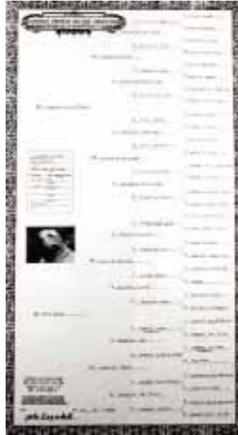
Suomalaisen NABA, EABA ja ABA -rekisteröidyn ameri-kanbulldoggin sukutaulu.

tunto sanoo jotain. Kamala vouthotus asiasta jonka pitäisi olla kristallin kirkasta alusta lähtien, mutta ah niin surullinen tosutilanne Suomessa.