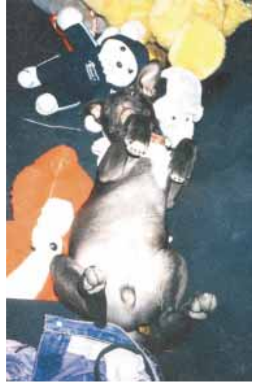
Pico pitbulli Pohjois-Suomesta kellii myöskin mielellään pyhien aikaan normaalia enemmän.