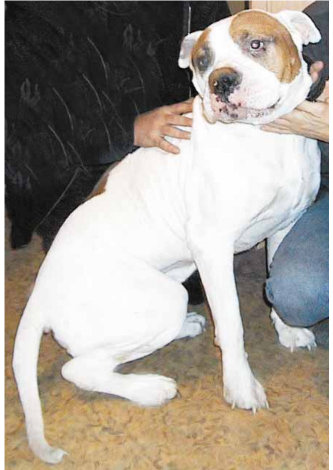
Monen suomalaisen amerikanbulldoggin esi-isä Bully oli komea näky vielä vanhana poikanakin. Bully oli tosi reipas ja hyvässä kunnossa ja kova vahtimaan.

sanoa, että kyllä suurin osa venäläisistä pitää koiristaan todella hyvää huolta. Koirat syövät laaturuokaa, niitä ulkoitetaan päivittäin tuntikaupalla, koiria kuntoutetaan jne. Venäläiset todella panostavat koiriinsa. Matkalla näimme myös vanhoja tuttuja koiria, joiden jälkeläisiä on myös Suomessa. Hieno reissu!