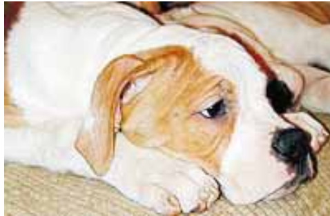
Amerikanbulldoggi DJ on Eestin tuontia. Omistaja on koiraan erittäin tyytyväinen!

Tällä hetkellä meillä Suomessa on noin nelisenkymmentä amerikanbulldoggia ja kyseessä on siis kaikilla tavoilla mitaten harvinainen koirarotu. Ja kun koiria on vähän ei pentuja aina ole tarjolla aivan naapurissa vaan ne on haettava ulkomailta asti!