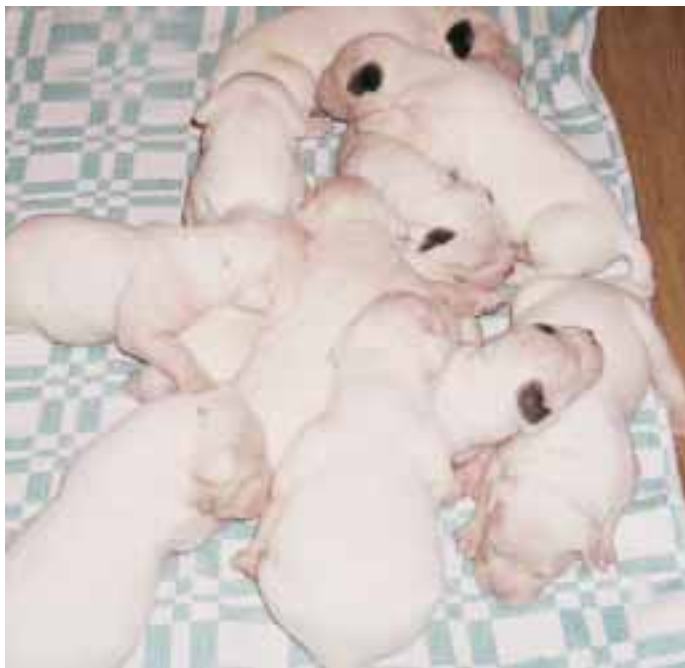
Kuvassa mahtava läjä Venäläisiä laatuamerikanbulldoggeja! Valinta näiden komeiden ja kauniiden pentujen välillä on todella vaikea.