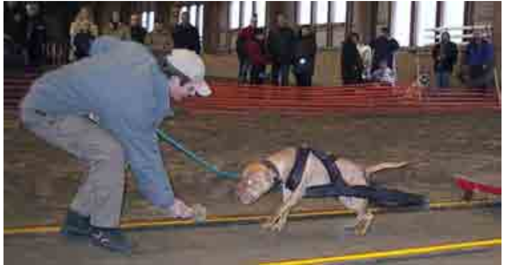
Nimensä mukaisesti hurjaakin hurjempi Baby Doll vetää taakkaa kuin vanhat tekijät ikään. Ilme kertoo kaiken.

Vaikka SATHY-tapahtumat ovat tunnettuja rennosta ja iloista ilmapiiristä oli tämän vuoden Expo iloisuuden ennätys. Kiitos kaikille kävijöille ja osallistujille.