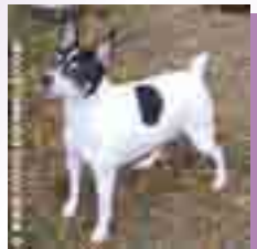
Tulevan pentueen emä: 'PR' Rocktalk Nell of Phoenix

Kennelissämme on suunnitteilla pentue alkuvuodeksi 2004. Pennut tulevat olemaan väritykseltään tri-color. Emä ja isä sekä heidän emät ja isät ovat 100 % terveitä, erikoiseläinlääkäriin virallisesti tarkastamia ja käytössä erinomaisiksi todettuja käyttökoiria.