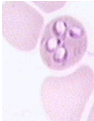
Tässä verisolussa on neljä babesia virusta.

Suomessa ei ole koirakan- taa, jolla olisi babesia. Suomessa on kuitenkin muutamia