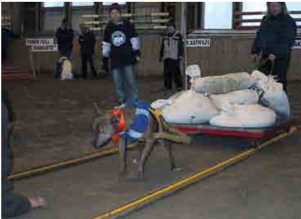
Suuren fanijoukon lisäksi ikääntyvän mestarin, amerikanpitbullterrieri Decemberin vetoja jännittivät omistaja, handleri ja avustajat.

Palkintojen määrä ja laatu oli tänä vuonna aivan omaa luokkaansa ja siitä olemme saaneet runsaasti positiivista palautetta. Jättimäiset pokaalit, kymmenien kilojen koiranruokasäkit, upeat diplomit, hienot lelut ja luut olivat tervetulleita palkintoja Pohjoismaiden työkoiramestareille! Osa palkintokustannuksista katettiin uusilla osallistumismaksuilla. Ensi vuonna jatkamme samaan malliin ja palkinnot tulevat olemaan hulppeita!