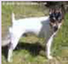
Tulevan pentueen isä: 'PR' Holmberg's Benjamin of Phoenix

emän emä: GR CH 'PR' Like a Rock of Phoenix emän isä: CH 'PR' Precious Grady of Phoenix