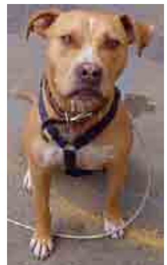
Testaa koirasi, jos edes epäilet sen kantavan babesiaa.

Sitten seuraa seuraava punasolujen romahdus ja tämä on se viimeinen vaihe. Tähän kuolevat lopulta nekin koirat, jotka selvisivät hengissä ensimmäisistä oireista.