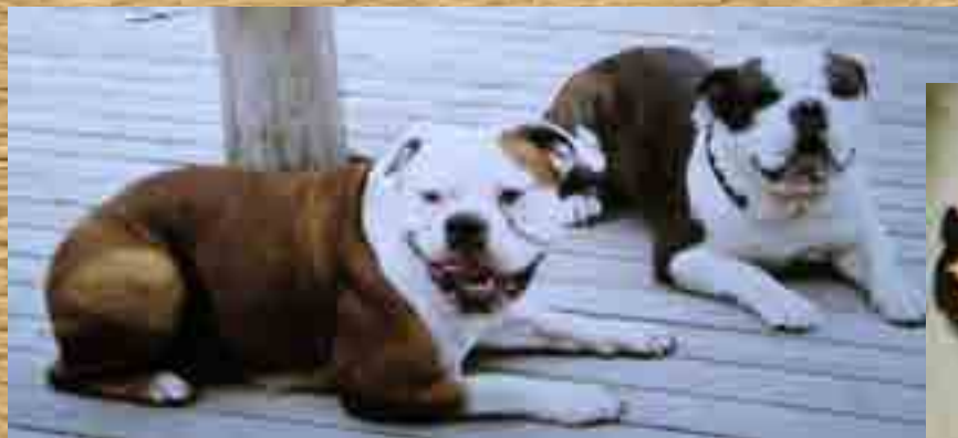
Vasemmalla Meku, pentueen äiti. Oikealla Tankki, pentueen isä.

Uusin pentue syntynyt 5.11.2003. Tämä pentue on Meku - Tankki yhdistelmä. Nyt on mahdollisuus varata pentuja, varausmaksu 150 e. Pentujen hinta 1200 e.