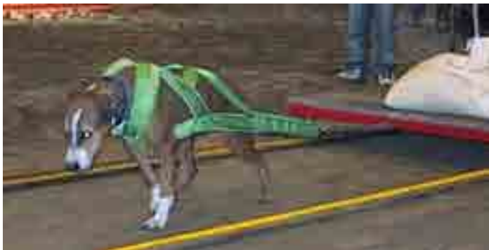
Yllä: Ei ne kaikkein kovimmat painot, vaan se oikea tyyli, tietää amerikanpitbullterrieri Hertta!