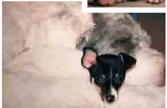
Yllä: Tara 8-viikkoisena Elmon hellässä huomassa.