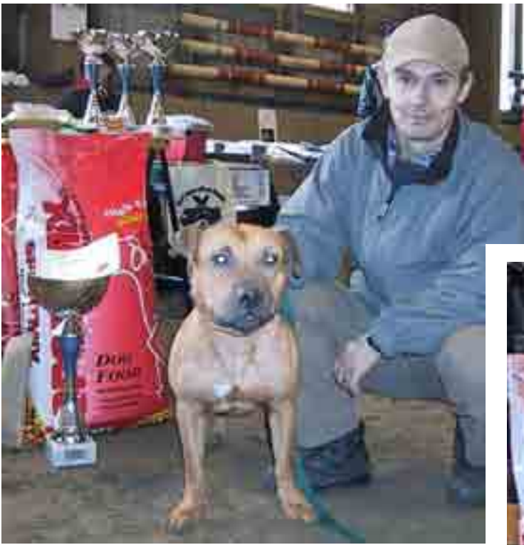
Vasemmalla: Voimavedon Pohjoismaiden mestari omassa luokassaan, amerikanpitbullterrieri Taisto R. odottaa totisena kuvausten päättymistä. Alla: Voimavedon Pohjoismaiden mestari omassa luokassaan, amerikanbulldoggi Remu piti erityisesti palkinnoksi saamastaan purulelusta.