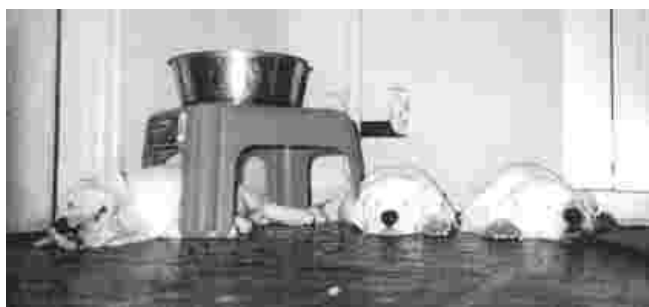
American Bulldog pups.

Pretext. Information of SATHY's publications for all the readers. Also SATHY's editorial staff welcomes YOUR material and stories.