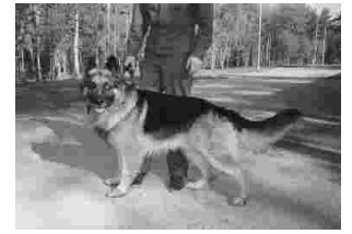
Jääkäri Makkosen koulutuskoira Simba.

Myös niinsanottuja räjähdekoiria käytetään armeijassa, koirat opetetaan tuntemaan erilaisten räjähdysaineiden hajut joita käytetään pommeissa ja miinoissa. Maastossa koira opetetaan etsimään näitä räjähteitä maasta ja ilmaiseamalla ne myös maahan menemällä, päinvastoin kuin tulli- ja poliisikoirat yleensä ilmaisevat huume- ja kätöjen sijainnin kaapimalla sitä kohtaa missä huumeet ovat, koska koirat opetetaan tehtävään leikin varjolla. Räjähdekoira ei saa kaapia kohtaa jossa miina on, koska silloinhan se voi räjähtää. Sotakoiran erikoiskou-