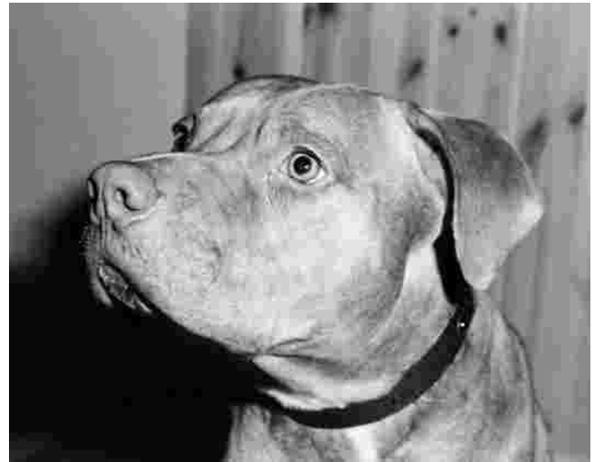
Rico viisivuotias amerikanpitbullterrieri-uros Forssasta lähettää terveisiä SATHY Uutiset -lehden lukijoille.