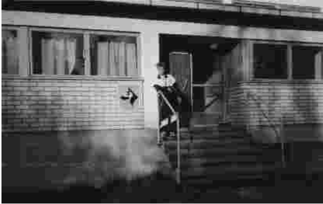
Sotakoiraosaston toimisto Niinisalon varuskunnassa.

Työkoiriin luetaan myös opaskoirat ja kaikenlaiset harrastuskoirat joita käytetään senkaltaisissa tehtävissä jotka ovat ihmiselle avuksi, niitä on niin tuhattomien paljon että en rupea niitä edes tässä luettelemaan.