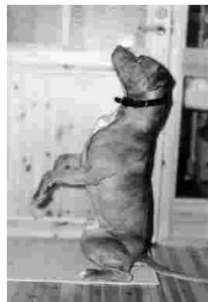
Rico the APBT.

English summary. this page. How to contact SATHY.