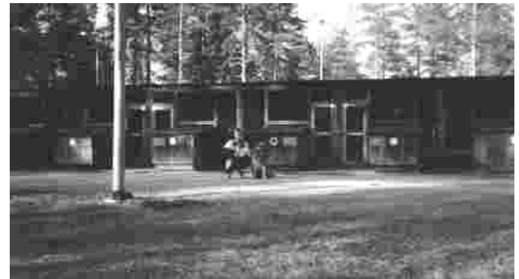
Yksi sotakoiraosaston neljästä koiratarhasta Yhteensä näissä tarhoissa oli parhaimmillaan n. 70 - 80 saksanpaimenkoiraa. Kuvassa myös SATHY:n pj sotakoiralla höystettynä.

Ansangan ilmaisu on myös yksi niistä tehtävistä joita ei siviilissä tarvita. Siinä koiran on ilmoitettava ansalangan paikka ennenkuin joukko-osasto törmää siihen. Ansalanka on kahden puun välille pingotettu lanka jonka